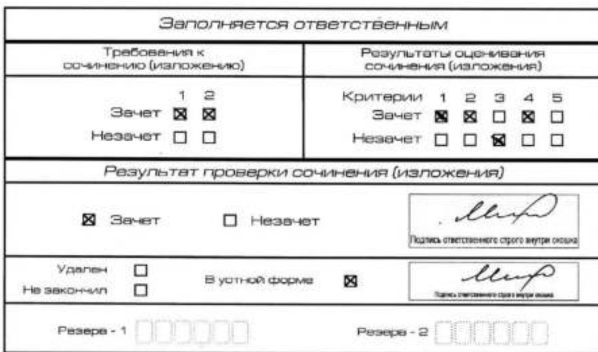
Рис. 11. Область для оценки работы сочинения (изложения) в устной форме

После окончания заполнения бланка регистрации ответственное лицо ставит свою подпись в специально отведенном для этого поле.