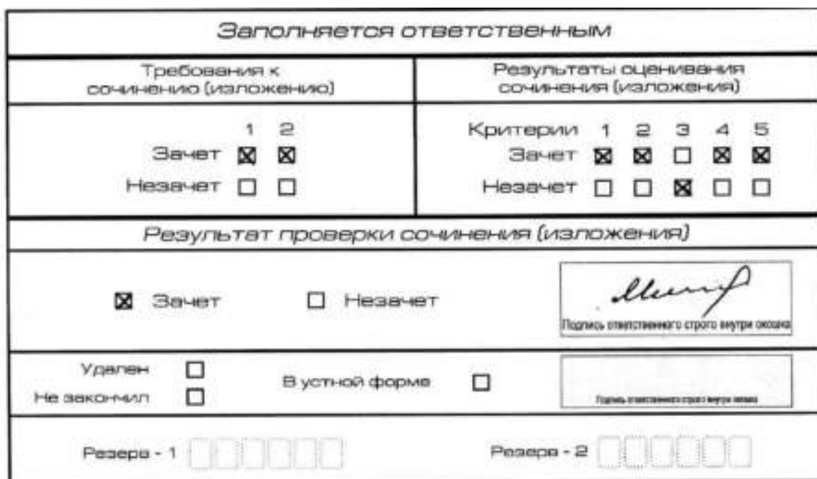
Рис. 10. Область для оценки работы

3. Во всех остальных случаях итоговое сочинение (изложение) проверяется по всем пяти критериям и оценивается по системе «зачет»/«незачет».