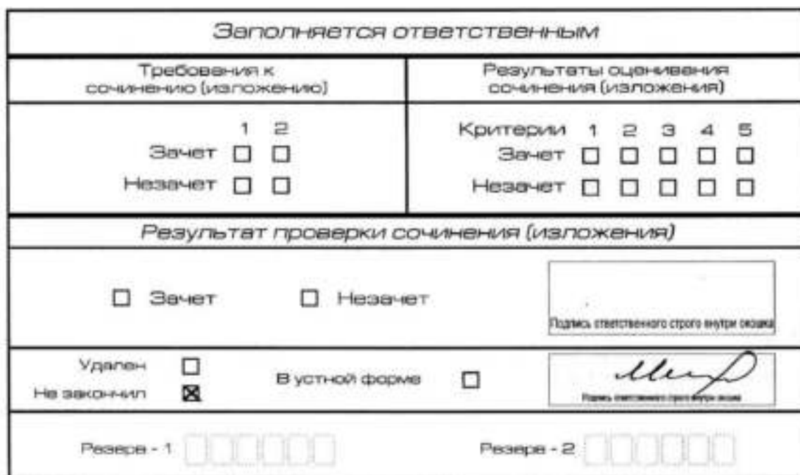
Рис. 12. Заполнение полей нижней части бланка регистрации (участник не закончил написание сочинения (изложения) по уважительным причинам)

В случае если участник итогового сочинения (изложения) по состоянию здоровья или другим объективным причинам не может завершить написание итогового сочинения (изложения), он может покинуть место проведения итогового сочинения (изложения). Члены комиссии по проведению итогового сочинения (изложения) составляют «Акт о досрочном завершении написания итогового сочинения (изложения) по уважительным причинам» (форма ИС-08), вносят соответствующую отметку в форму ИС-05 «Ведомость проведения итогового сочинения (изложения) в учебном кабинете ОО (месте проведения)» (участник итогового сочинения (изложения) должен поставить свою подпись в указанной форме). В бланке регистрации указанного участника итогового сочинения (изложения) необходимо внести отметку «Х» в поле «Не закончил» для учета при организации проверки, а также для последующего допуска указанных участников к повторной сдаче итогового сочинения (изложения) в дополнительные сроки. Внесение отметки в поле «Не закончил» подтверждается подписью члена комиссии по проведению итогового сочинения (изложения) (см. рис. 12).