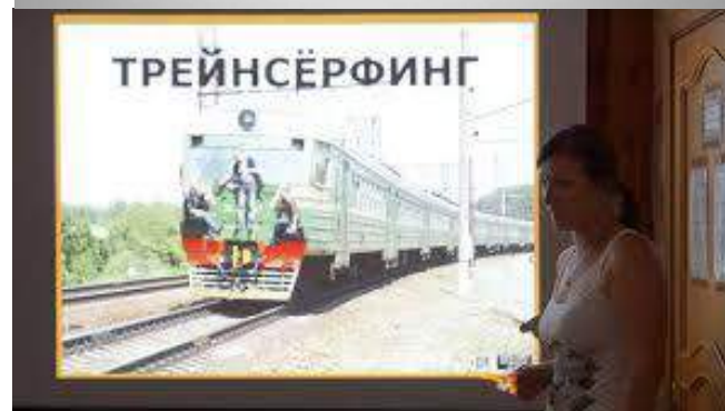
ПРАВИЛА ПОВЕДЕНИЯ ДЛЯ ДЕТЕЙ ПРИ НАХОЖДЕНИИ НА ЖЕЛЕЗНОДОРОЖНЫХ ПУТЯХ

Если возникает тяга к этому смертельному развлечению, нужно прежде всего ответить себе на вопрос «Стоит ли рисковать своей жизнью, чтобы получить на одно мгновение иллюзию свободы?»